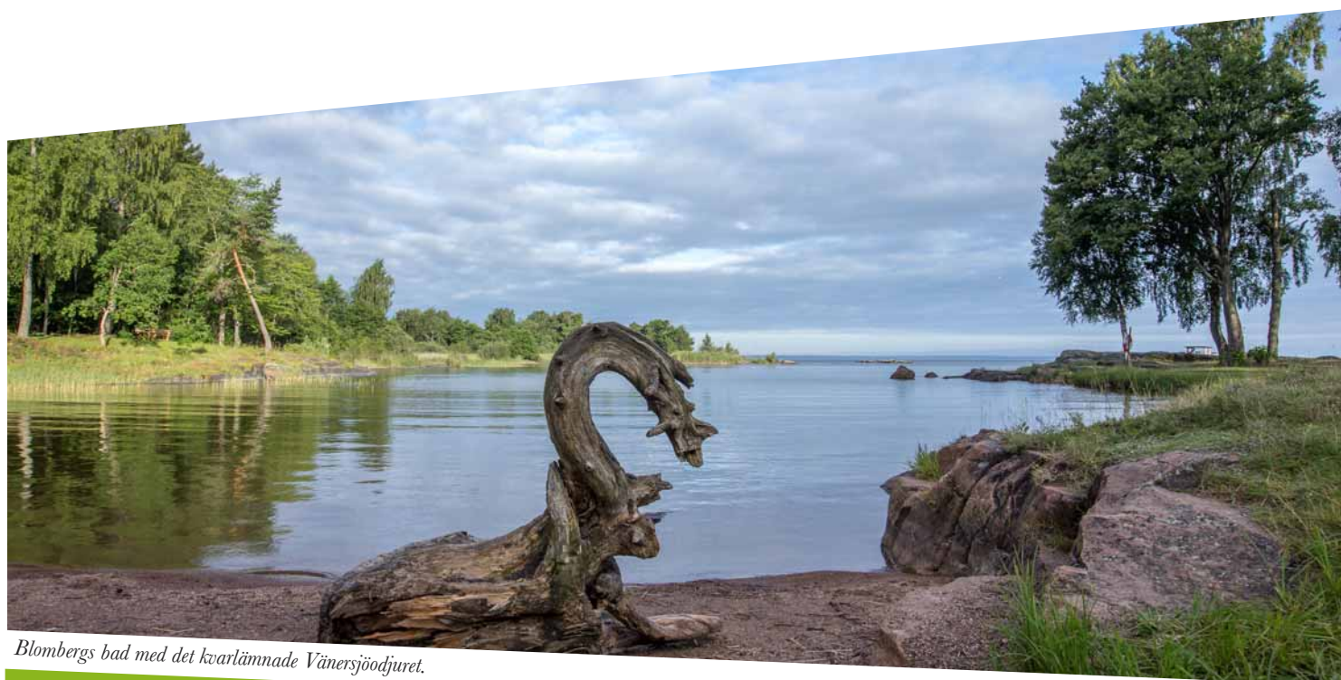
Blombergs bad med det kvarlämnade Vänersjöodjuret.