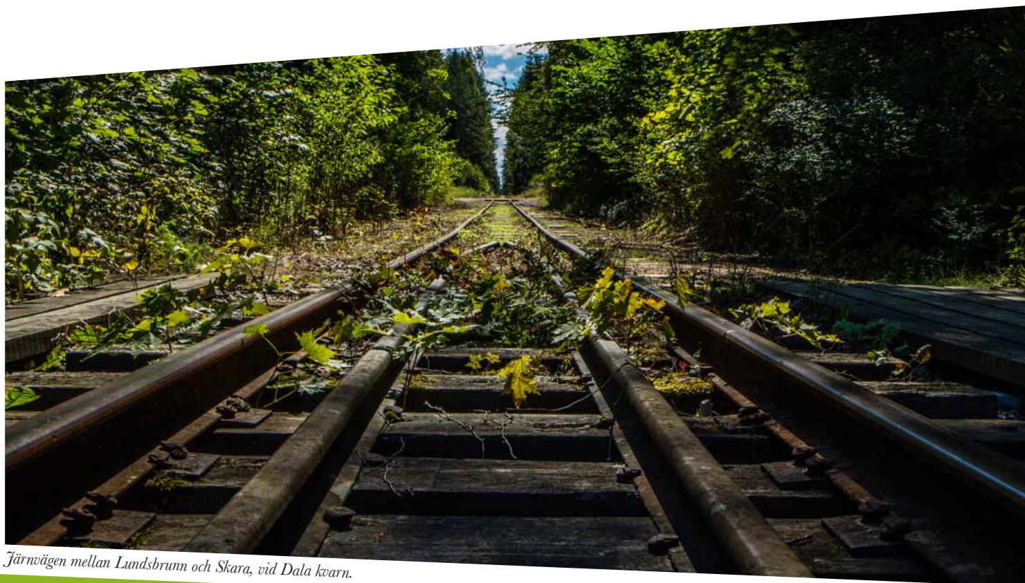
Järnvägen mellan Lundsbrunn och Skara, vid Dala kvarn.