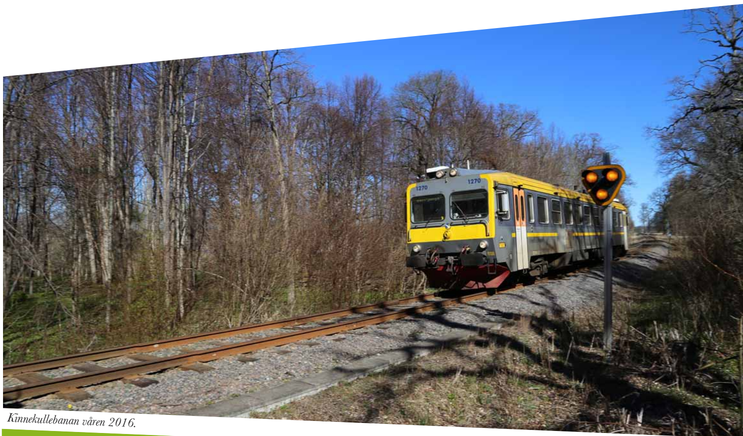
Kinnekullebanan våren 2016.

Investeringar planeras för en fyraårsperiod. Målet är en investeringsram på 160 mnkr för planeringsperioden. Till följd av stora