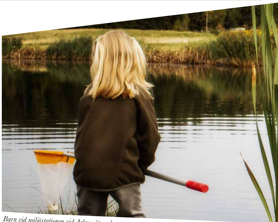
Barn vid miljöstationen vid Arlas våtmark.