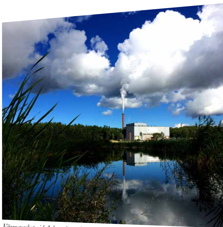
Värmeverket vid Arlas våtmark.