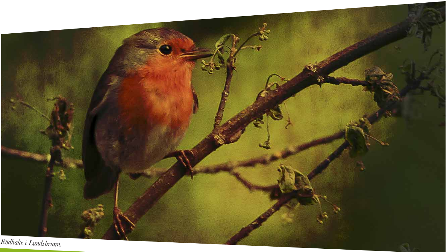
Rödhake i Lundsbrunn.

Investeringsbudgeten för inköp av strategisk mark är 0,5 mnkr per år under planeringsperioden.